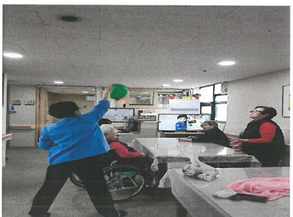
생활실에서 머리도 다듬으시고 프로그램에도 참여하십니다.