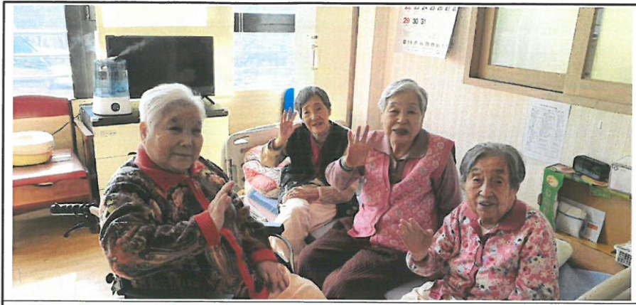
달소도 나누시며 잘 지내고 계십니다.