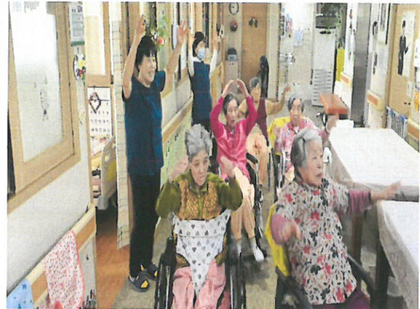
모니터를 보시고 따라하십니다.